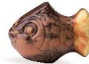
Praliné croustillant aux éclats de crêpe dentelle