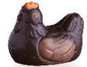
Caramel tendre d'Isigny