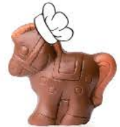
Praliné croustillant aux éclats de crêpe dentelle