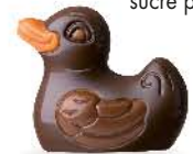
Praliné avec éclats de pistaches