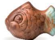
Praliné et noix de coco caramélisée