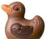
Praliné avec sucre pétillant