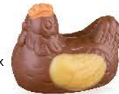
Duo praliné et caramel