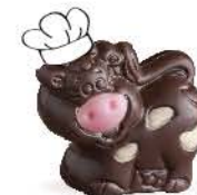
Praliné avec sucre pétillant

Nos chocolats sont présentés dans des alvéoles qui les protègent et leur permettent de voyager dans les meilleures conditions.