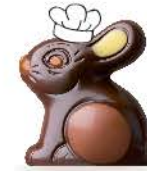
Praliné noisettes moelleux