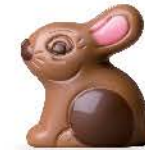
Praliné et riz soufflé

Les ballotins se présentent en 3 DÉCORS ASSORTIS**