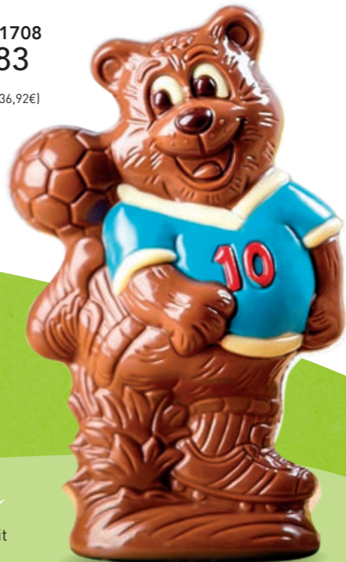
Footy - 185 g Moulage chocolat au lait H 19 cm