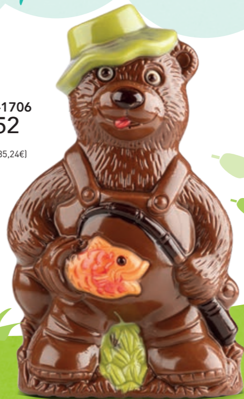
Grizzly 185 g Moulage chocolat au lait H 17 cm

J'y suis presque... À moi le beau poisson multicolore ! Miam !