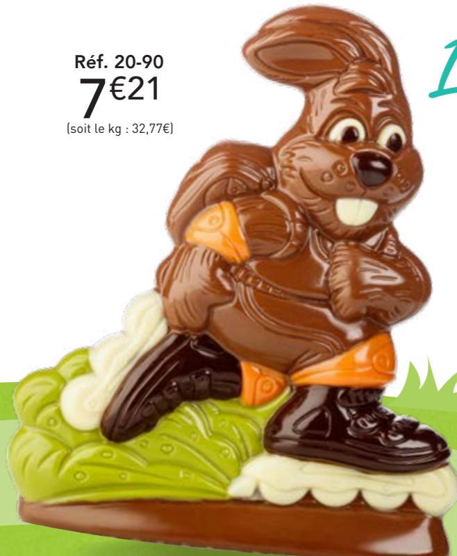
Rolly - 220 g Moulage chocolat au lait H 19,5 cm