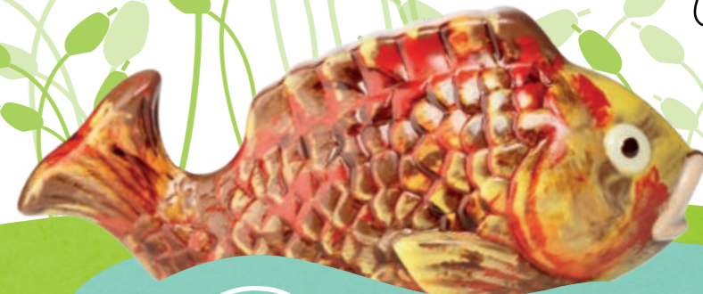
Ploufy - 160 g Moulage chocolat au lait H 9 cm